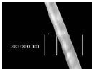
Un cheveu : 100 000