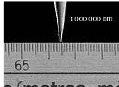
Une mine de crayon : un million!

Par comparaison, le virus de l'influenza, la plus petite structure biologique fonctionnelle, fait 100 nanomètres. La bactérie E-Coli, 1000 nanomètres. À 10 000 nanomètres, un globule blanc est énorme. Un simple cheveu fait 100 000 nanomètres. Enfin, une mine de crayon mesure un million de nanomètres. L'observation et la manipulation de l'atome et des molécules relèvent donc de l'exploit!